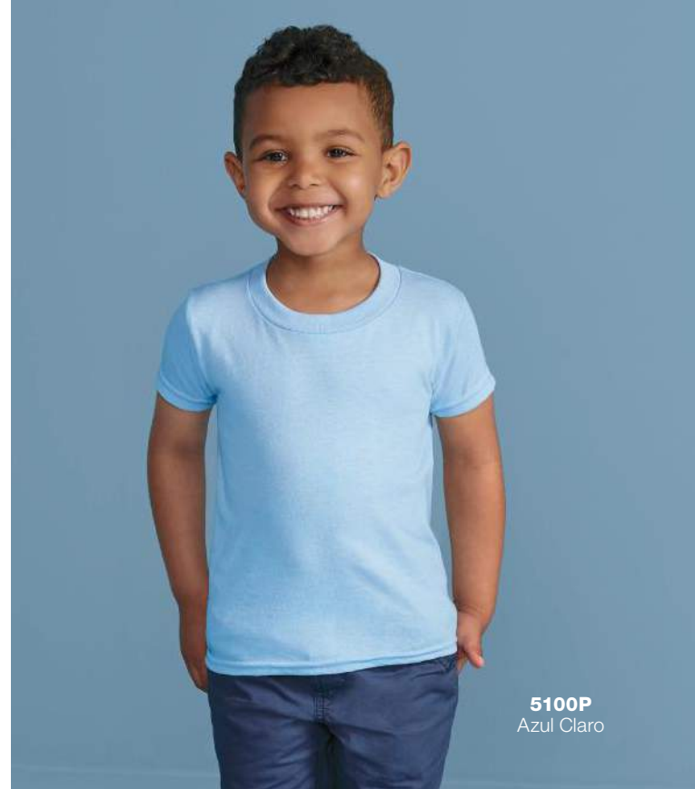
5100P Azul Claro