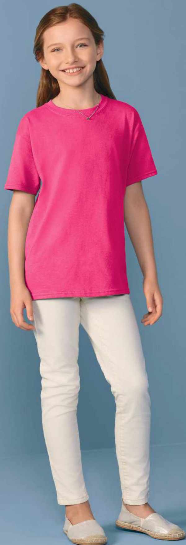
64500B Rosa Tropical

Estilo ofrecido en tallas para Adulto y para Damas *A = % Algodón, P = % Poliéster